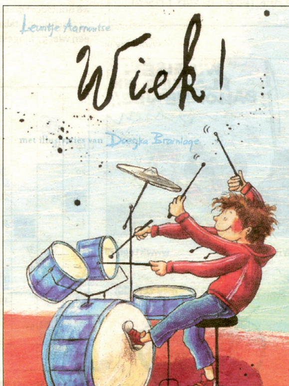
Wiek bereikt met drummen het hart van zijn vader

Stemmen kan tot 5 november op www.pzc.nl/publieksprijs of schriftelijk: PZC o.v.v. PZC Publieksprijs, Postbus 91, 4330 AB Middelburg.